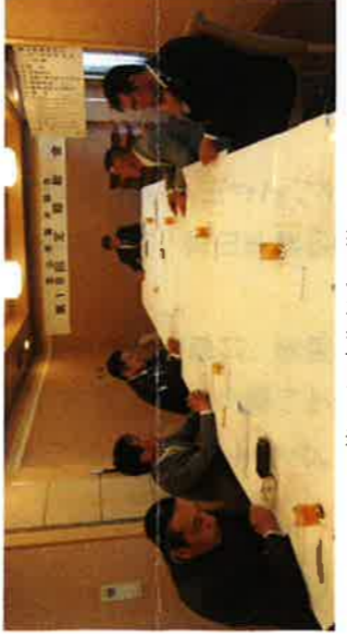
第18回定期総会の様子