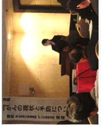
渡邊氏講演の様子

会員・賛助会員二十名が参加し、富山県のがんの実態やがん検診を受診し、早期発見・早期治療する事の大切さ、日常生活におけるがん予防について受