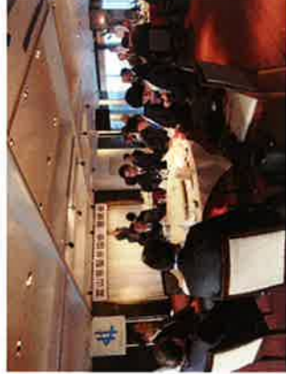
定期総会懇親会の様子

講演会後、午後五時三十分より富山第一ホテル十三階ルミエールにて懇親会が開催された。 当日は来賓・会員・賛助会員総勢二十七名の参加があり、親睦を深め合った。