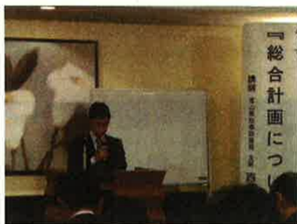
西海氏ご講演の様子

政策の柱である『活力とやま』『未来とやま』『安心とやま』の各分野には計六十の基本政策があり、産業や観光の発展、環境の保全や子育て支援、医療や福祉の充実等、十年後の目指すべき将来像「元気な富山県」の実現に向けた様々な取り組みを紹介いただきました。おわりに、富山県は全国トップクラスの住みやすい県であるという統計を紹介され、改めて恵まれた環境の中で生活していることを実感しました。