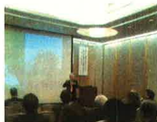
記念講演会の様子