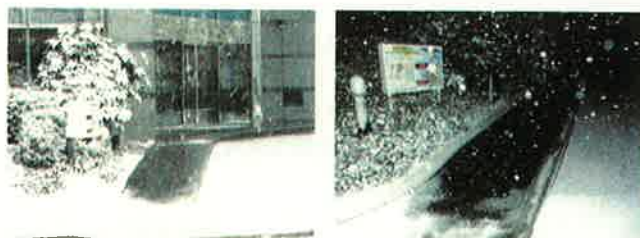
地熱ヒートパイプ融雪システム実験施設(興和本社玄関前)