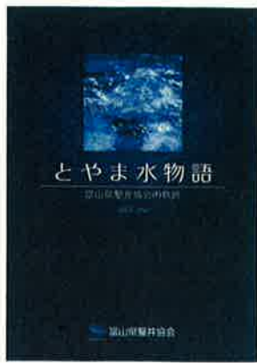
記念誌 とやま水物語

富山県鑿井協会は、広く市民の方に「井戸・地下水」の大切さを理解していただくことを目的に2001年より1月10日(いど)を『井戸の日』を制定しました。以来、全国へと発信を続け2006年より全国さく井協会が主体となり、11月10日(い〜いど)に改め毎年、全国各地で「い〜い井戸の日記念フォーラム」を開催しています。2012年は富山県、富山国際会議場で開催いたしました。富山から発信した『井戸の日』が全国展開し再び富山に戻って参りました。これを期に、その集大成として記念誌『とやま水物語』を制作いたしました。