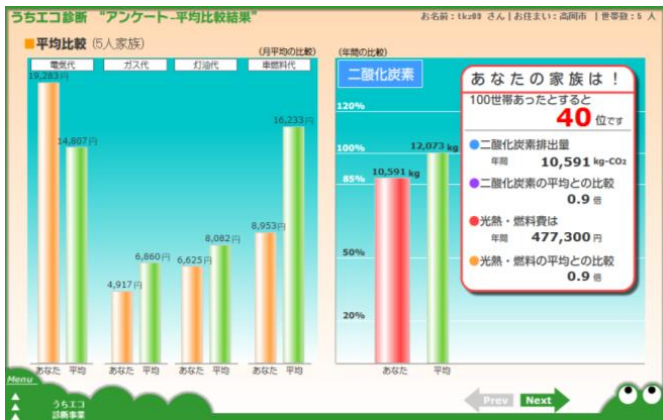
今のお宅は平均と比較して…