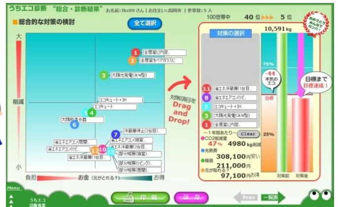
お宅にあった省エネ対策を検討し、実施すると…