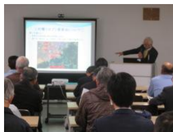
名水の保全について《講義》