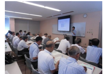
地下水の守り人による活動報告