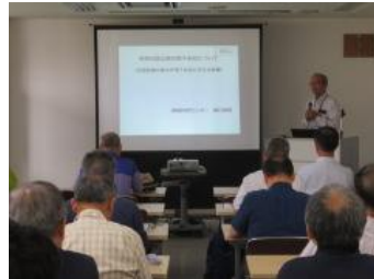
地下水の守り人による活動報告