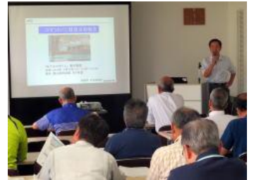
地下水の守り人による活動報告