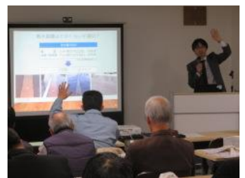
消雪設備の利用について《講義》