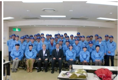
28年度養成講座受講者