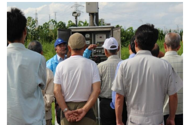
消雪設備の節水方法についての実習