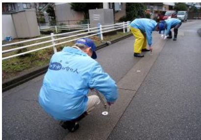
散水ノズルの点検